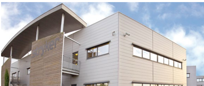
SIÈGE SOCIAL STRYKER - Pusignan (Lyon)*