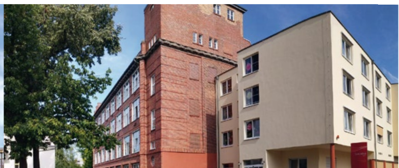
EHPAD Alzheimer - Guben (Allemagne)*