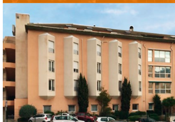
EHPAD Alzheimer - Bastia*

*Investissements déjà réalisés qui ne préjugent pas des investissements futurs.