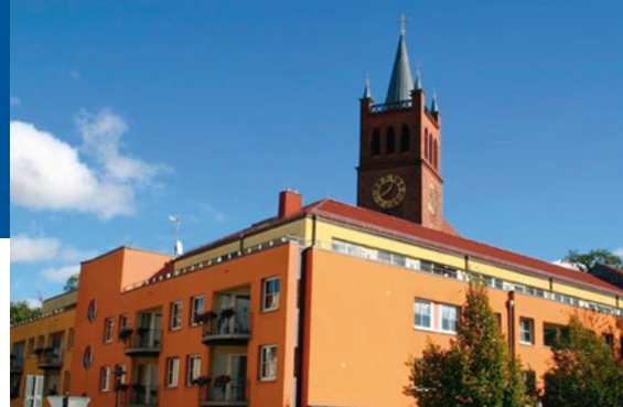
EHPAD Alzheimer - Müncheberg (Allemagne)*