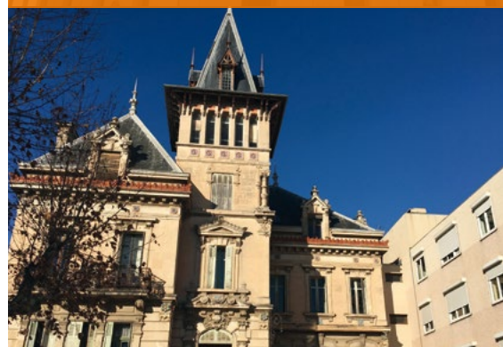
CLINIQUE MCO - Salon de Provence*