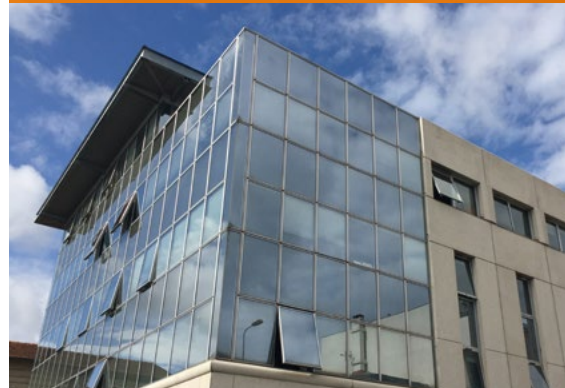
CABINET DE CONSULTATION CARDIOLOGIQUE - Bordeaux*