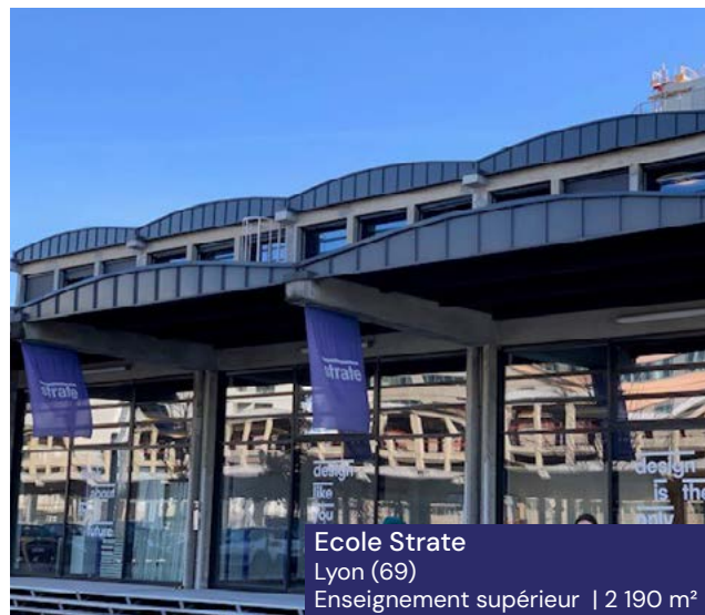
Ecole Strate Lyon (69) Enseignement supérieur | 2 190 m 2

Avec une plateforme européenne de professionnels de l'immobilier , permettant une sélection fine immeubles et des locataires, la SCPI vise à se constituer un patrimoine composé de bureaux, de commerces et de locaux d'activités ou d'entrepôts, mais également de typologies innovantes telles que la santé, l'hôtellerie ou encore le résidentiel géré (étudiant, senior, coliving) en France et dans des États qui ont été membres ou qui sont membres de l'Union Européenne.