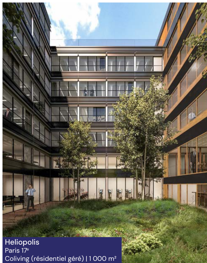
Heliopolis Paris 17 e Coliving (résidentiel géré) | 1 000 m 2